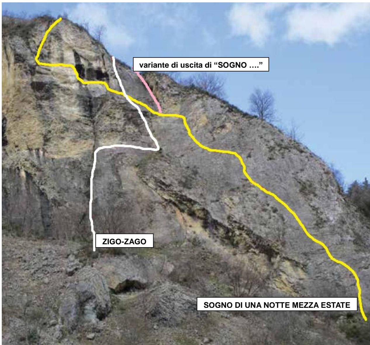
Nella foto i tracciati delle vie della parete

N.B.: è anche possibile evitare il tiro finale (che comunque è il più bello) salendo direttamente un diedro che in breve conduce in cima (si veda a riguardo il disegno).